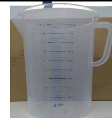
4. Jarra plástica graduada