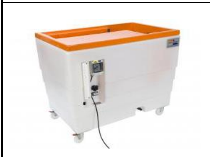
1. F1-10 - Banco Hidráulico