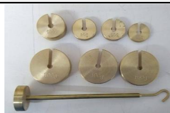
3. Peso colgante e individuales.