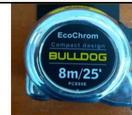
5. Cinta métrica