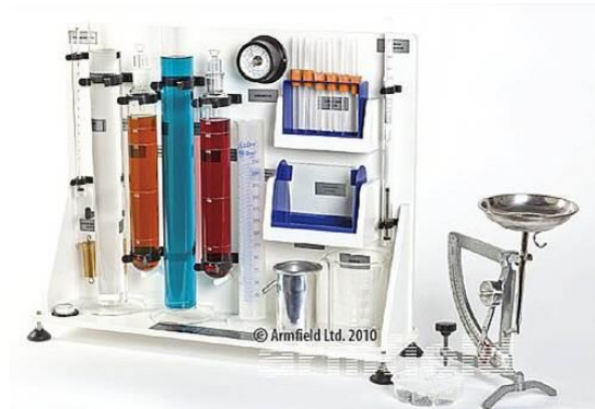
Figura 1 F1-30 Equipo de Propiedades de fluidos