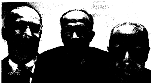
Bardeen, Shockley y Brattain

trones de conducción. Pudo comprenderse entonces, entre 1928 y 1933, la diferencia entre conductores, aislantes, y semiconductores. Wigner y Seitz realizaron por aquella época los primeros cálculos realistas de una estructura de bandas para el sodio. Los avances posteriores, hasta llegar al transistor, tuvieron lugar fundamentalmente en Estados Unidos. Allí se combinaron poderosos intereses económicos de diversos sectores industriales (eléctrico, de comunicaciones, metalúrgico o fotográfico), con el trabajo de importantes físicos cuánticos, algunos americanos (Slater, Condon, van Vleck, Rabi) y otros venidos de Europa (Wigner, Bloch, Bethe), que proponían teorías y cálculos cada vez más precisos de propiedades de sólidos interesantes para esta industria. Los tres inventores del transistor pueden relacionarse directamente con eminentes teóricos cuánticos: Bardeen estudió mecánica cuántica con van Vleck en Wisconsin y con Wigner en Princeton; Shockley fue estudiante de doctorado en el grupo de Slater en Massachusetts, que en los años treinta se dedicó a aplicar la mecánica cuántica para entender las propiedades eléctricas magnéticas y térmicas de metales y otros materiales. Por último, Brattain asistió a un curso que Sommerfeld impartió en Michigan en 1931 sobre teoría electrónica de los metales.