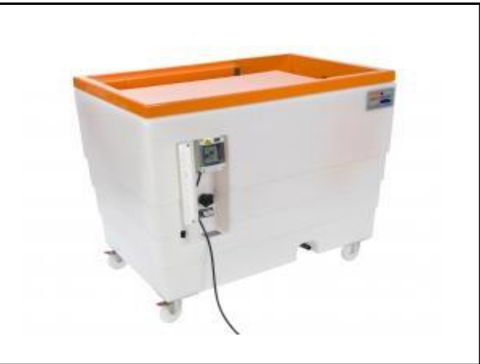
1. F1-10 - Banco Hidráulico